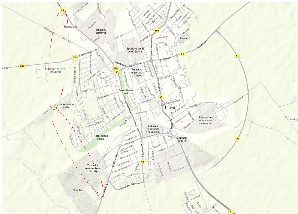
Obr.1 Oblasť vedenia západného obchvatu mesta Trnava