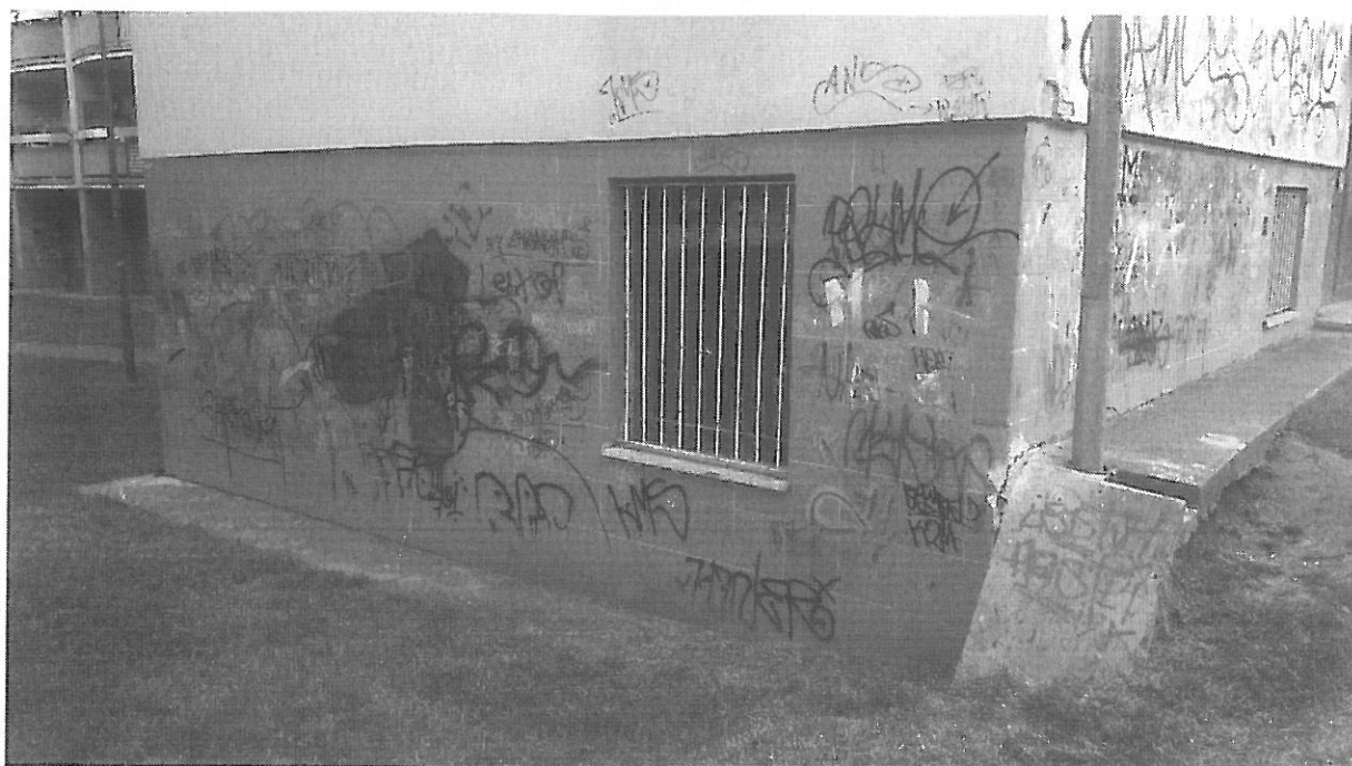
Pohľad na bytovú jednotku, ktorá sa nachádza v spodnej časti bytového domu.