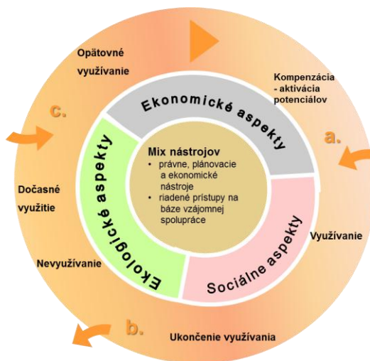
Obr. Diagram opätovného funkčného využitia územia, Difu

Manažment opätovného funkčného využitia územia reprezentuje integračnú politiku, riadený, plánovaný prístup, ktorý predpokladá zmenu vo filozofii využitia územia zameranú na aspekt efektívneho funkčného zužitkovania územia. Táto filozofia sa dá vyjadriť heslom „ nevyužívať – opätovne použiť – kompenzovať“.