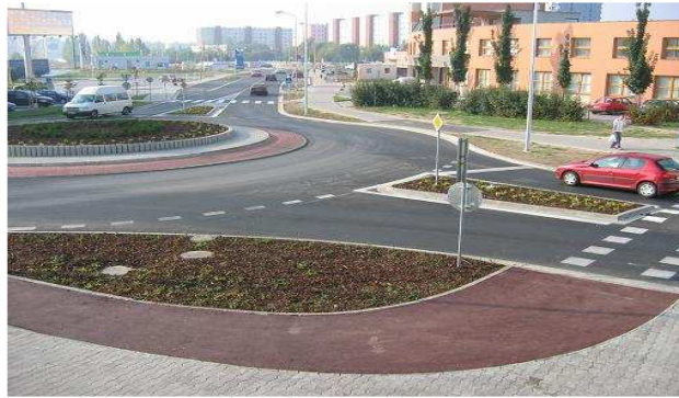
rekonštrukcia MK Veterná

Finančné prostriedky boli použité na realizáciu rekonštrukcie časti Veternej ulice vrátane kruhového objazdu v križovatke so Saleziánskou ulicou. Súčasťou rekonštrukcie bola aj realizácia verejného osvetlenia, sadových úprav, prekládky VN káblov a vodomernej šachty.