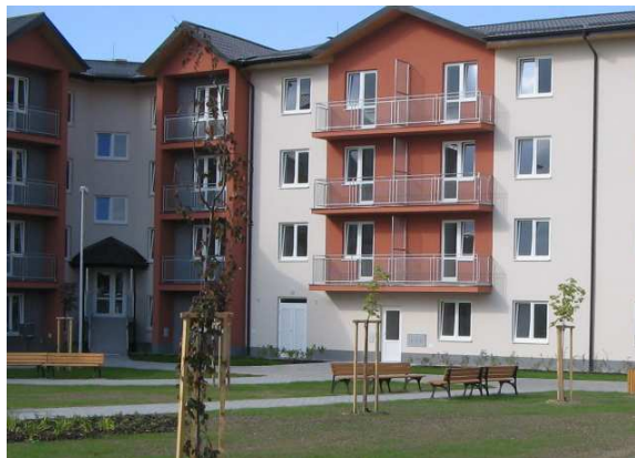
Obytný súbor Clementisova ulica

Výstavba obytného súboru bola zahájená v roku 2005. Celkovo bolo zrealizovaných 88 b.j. V roku 2006 stavebné práce pokračovali a celý obytný súbor bol ukončený. Zrealizované boli práce na fasádach a strechách bytových domov, vnútorné stavebné úpravy stien a podláh elektroinštalácie, zdravotníka, vzduchotechnika, ústredné kúrenie, montáž zariadení kuchýň, montáž pivničných kójí, dodávka a sprevádzkovanie centrálnej výmenníkovej stanice a odovzdávacích staníc tepla vrátane merania a regulácie. Ďalej bolo zrealizované nové verejné osvetlenie, povrchy chodníkov a parkovísk, sadové úpravy a montáž vybavenia detských ihrísk (hojdačky, preliezky a pod.).