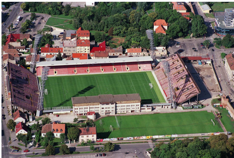
futbalový štadión A. Malatinského

V rámci rekonštrukcie vnútorného oplotenia bol zrealizovaný betónový múrik po obvodě hracej plochy v rozsahu reglementu FIFA pre medzištátne zápasy a premier ligy s novým ochranným zábradlím od hľadiska východnej a západnej tribúny, rampa pre imobilných na východnej tribúne, prekrytie spodných radov oceľových tribún na severnej a južnej tribúne, vstupný priestor do hráčskych kabín pod východnou tribúnou a ochranné siete za futbalovými brámkami.