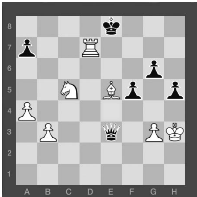
Postavenie po 48. - D×e3 (7 - 6)