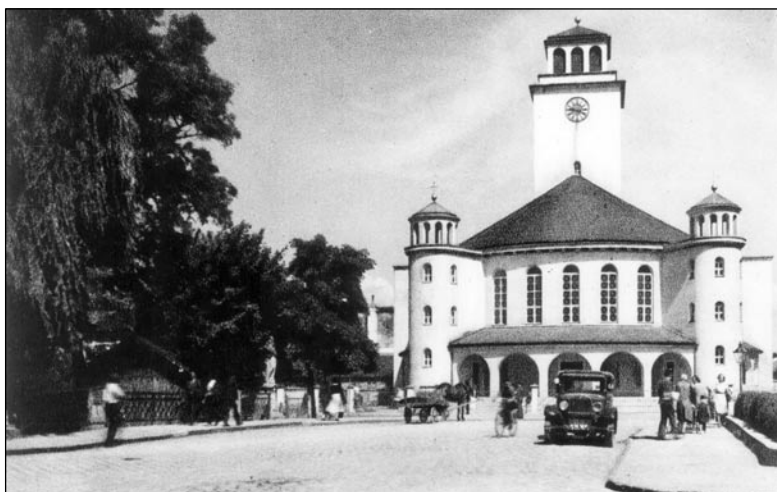
Evanjelický kostol na starej pohľadnici, 30. roky 20. storočia