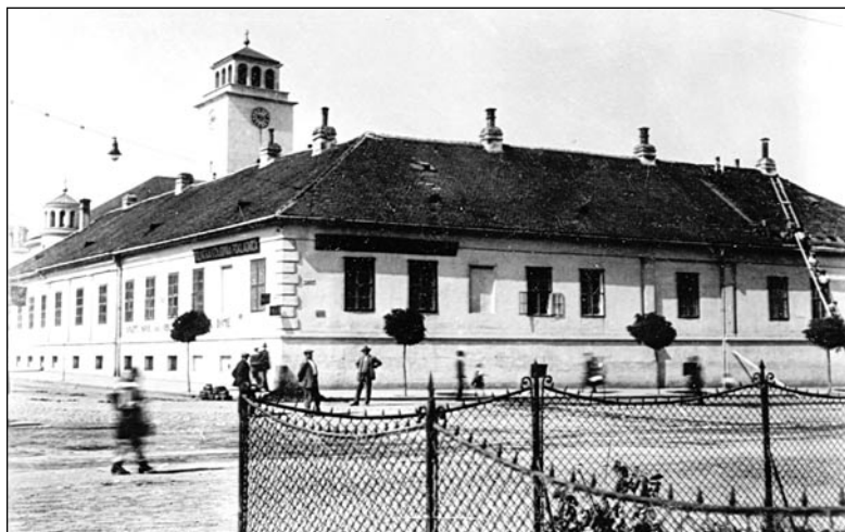
Objekt, ktorý patril Hotelu Polnitzky, po roku 1924