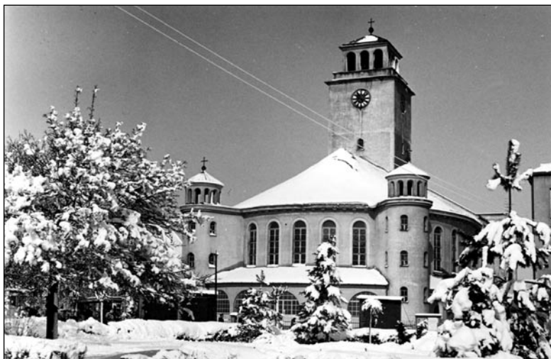
Zimný parčík, fotografia

Len nedávno vybuodovalo mesto v tejto časti parku popri chodníku pre peších cyklotrasu, ktorá ďalej smeruje k staničnému parku. Dnes sa opäť dívame na čulý pracovný ruch, ktorý predchádza novému vzhľadu tohto miesta. Obyvatelia sa už mohli zoznámiť s projektom obnovy parku a jeho vizualizáciou. Rešpektuje trasu peších, ktorí sa zvyčajne náhlia k lávke ponad križovatku k železničnej stanici. Revitalizácia parku ráta aj s posunutím sochy Štefánika o zopár metrov do trávnej plochy. Nuž, Štefánik vždy rád cestoval. Staré konštrukcie galérie cti vystriedajú kvetinové záhony a oddychové zóny. Niekdajšia Malá promenáda sa v lete 2015 premení na moderný park. ■