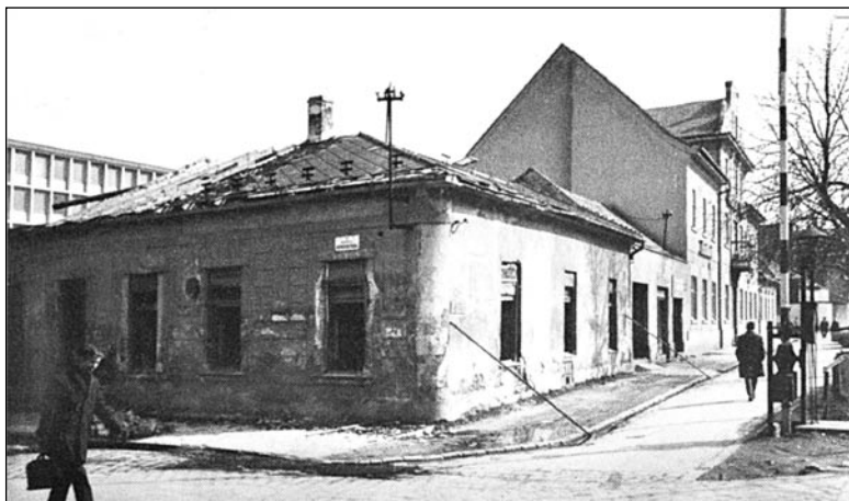
Hostinec Maxa Grünsteina na rohu Hospodárskej ulice, 1980