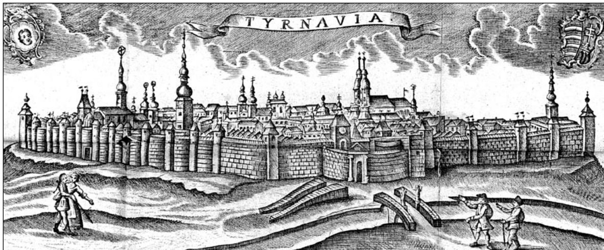
Veduta Trnavy s Dolnou bránou a barbakanom, most cez Trnávku so sochami, 18. storočie