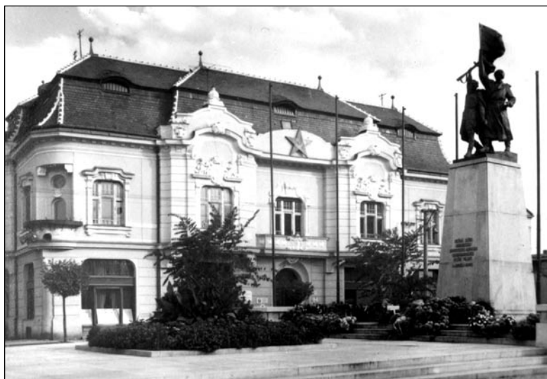
Pomník osloboditeľov, pohľadnica po roku 1960