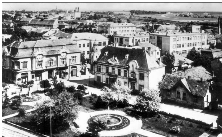
Pohľad zhora na parčík, dnes Námestie SNP, pohľadnica