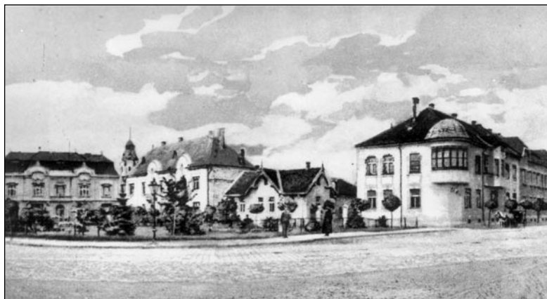
Nové námestie s parčíkom, pohľadnica cca 1914-23