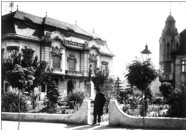
Park na starej pohľadnici, 40. roky 20. storočia