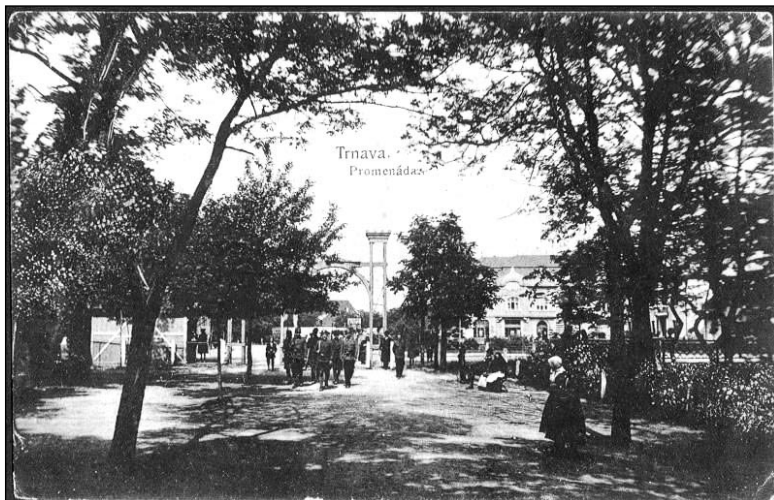
Malá promenáda na starej pohľadnici

Na starých vedutách Trnavy bolo miesto v juhozápadnom rohu hradieb ešte prázdne, tieklo tadiaľ jedno rameno Trnávky, ktoré sa s druhým spájalo ďaleko na mieste za dnešnou Kollárovou ulicou pred traťou. Za barbakanom Dolnej brány bol most cez potok, na ktorý v 18. storočí pribudli dve sochy, a ďalej viedla cesta z Trnavy do Bratislavy. Začiatkom 19. storočia zbúrali obidva barbaky, neskôr i Hornú a Dolnú bránu a priestor sa otvoril. Zástavba sa postupne rozšírila a už koncom 19. storočia bolo územie za bývalou Dolnou bránou pomerne rušné. Na tomto strategickom mieste neďaleko stanice stálo niekoľko hostincov. Na Hospodárskej ulici pri Trnávke, ktorá sa v týchto miestach otáčala smerom k dnešnému evanjelickému