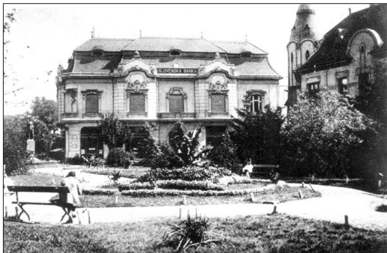
Parčík s kruhovým kvetinovým záhonom a obďaleč pomník Štefánika, pohľadnica

V osemdesiatych rokoch bol v parčíku pozdĺž chodníka osadený rad oranžových konštrukcií