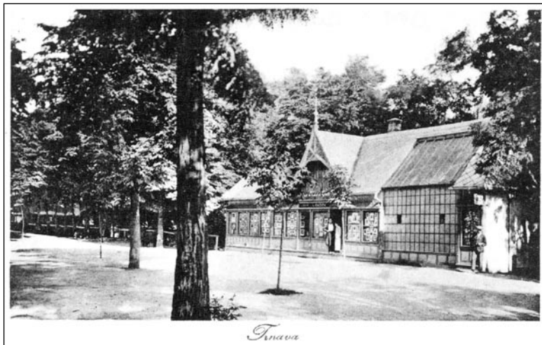
Pavilón s fotoateliérom Andók v Malej promenáde, okolo 1925

Cez Trnávku viedli v týchto miestach tri mosty naznačené na katastrálnej mape z roku 1895. Najstarší cestný most sme už spomínali, stáli na ňom