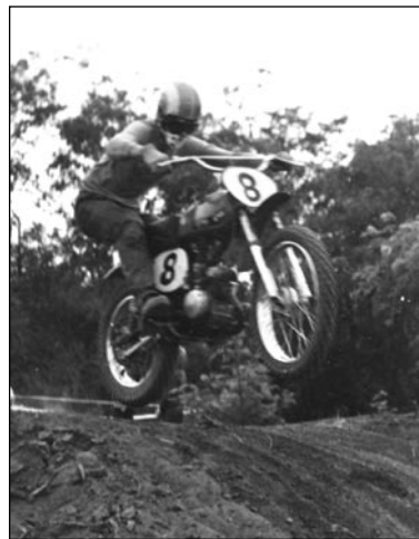
Pretekárska trať trnavských motokrosov viedla aj v lesíku pri terajšom mestskom zimnom štadióne.