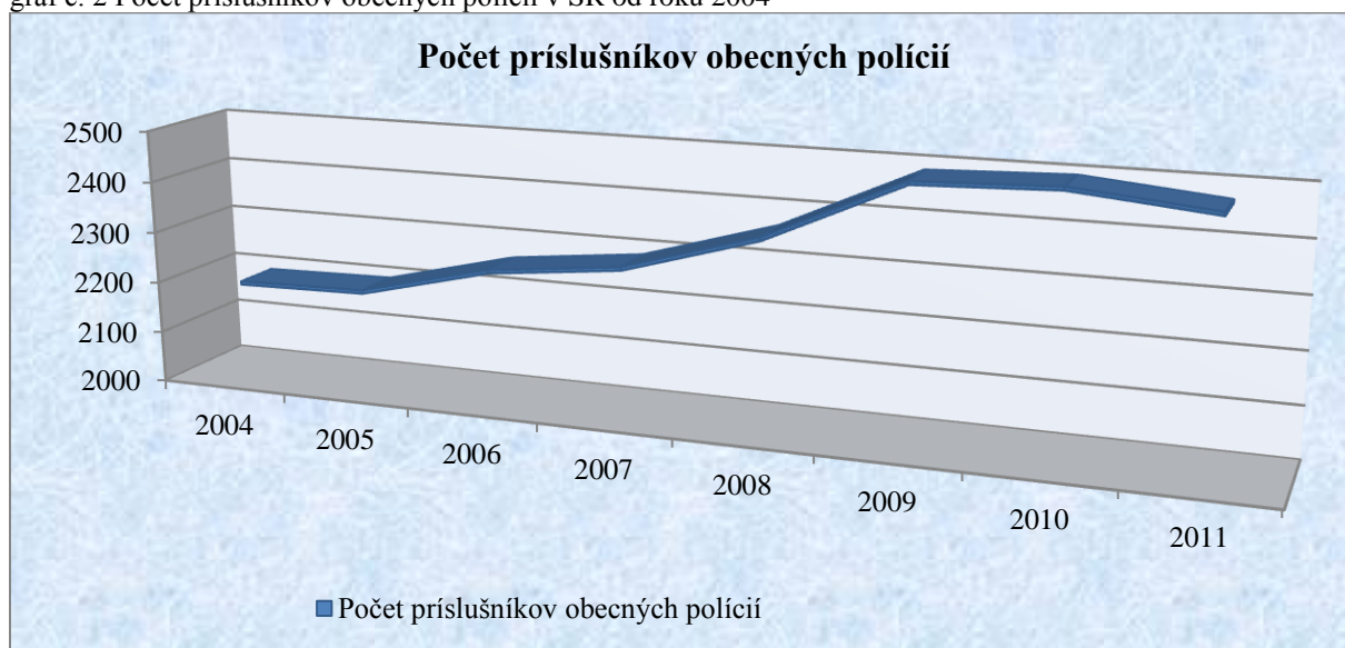
graf č. 2 Počet príslušníkov obecných polícií v SR od roku 2004

Z analýzy štatistických údajov vyplynul aj zaujímavý fakt, že z hľadiska počtu príslušníkov obecných polícií zamestnaných v jednotlivých obciach, v Slovenskej republike aj