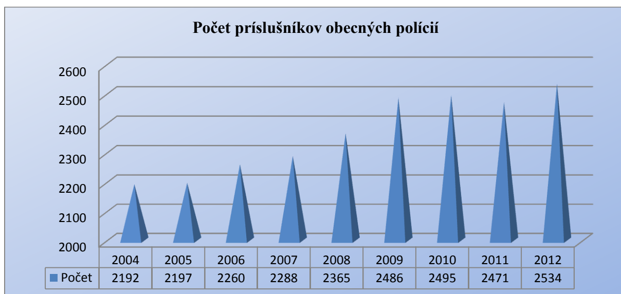
graf č. 2 Počet príslušníkov obecných polícií v SR za obdobie rokov 2004 - 2012

Počet príslušníkov obecných a mestských polícií za obdobie rokov 2004 – 2012 preukazuje rastúce tendencie. V priebehu minulého kalendárneho roka bolo evidovaných 2 534 príslušníkov obecnej a mestskej polície, čím ich počet prvýkrát prekročil hranicu 2 500. Z komparácie dlhodobých vývojových trendov počtu obecných a mestských polícií a počtu ich príslušníkov vyplýva, že vývoj počtu obecných a mestských polícií korešponduje s vývojom počtu príslušníkov obecných a mestských polícií.