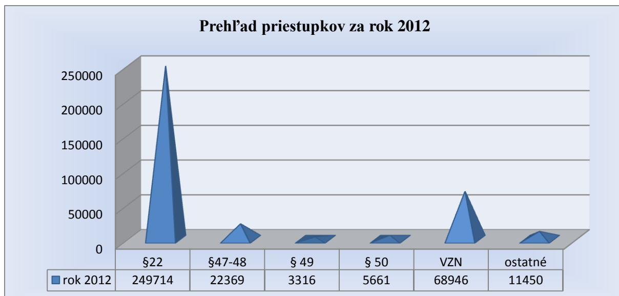
graf č. 4 Prehľad zistených a oznámených priestupkov

Jednotlivé obecné a mestské polície v závislosti od špecifik obce 5) , bezpečnostnej situácie obce a priorit starostu obce a obecného zastupiteľstva zameriavajú svoju činnosť na zákonodarcom zverenú oblasť protiprávnej činnosti v rôznej miere a v rôznej intenzite. Nižšie uvedený graf č. 4 zobrazuje podiel jednotlivých skupín priestupkov 6) z celkového počtu priestupkov zaregistrovaných obecnými políciaми v roku 2012 (t. j. ide o priestupky, ktoré obecné a mestské polície zistili vlastnou činnosťou a priestupky, ktoré boli obecným políciaм oznámené).