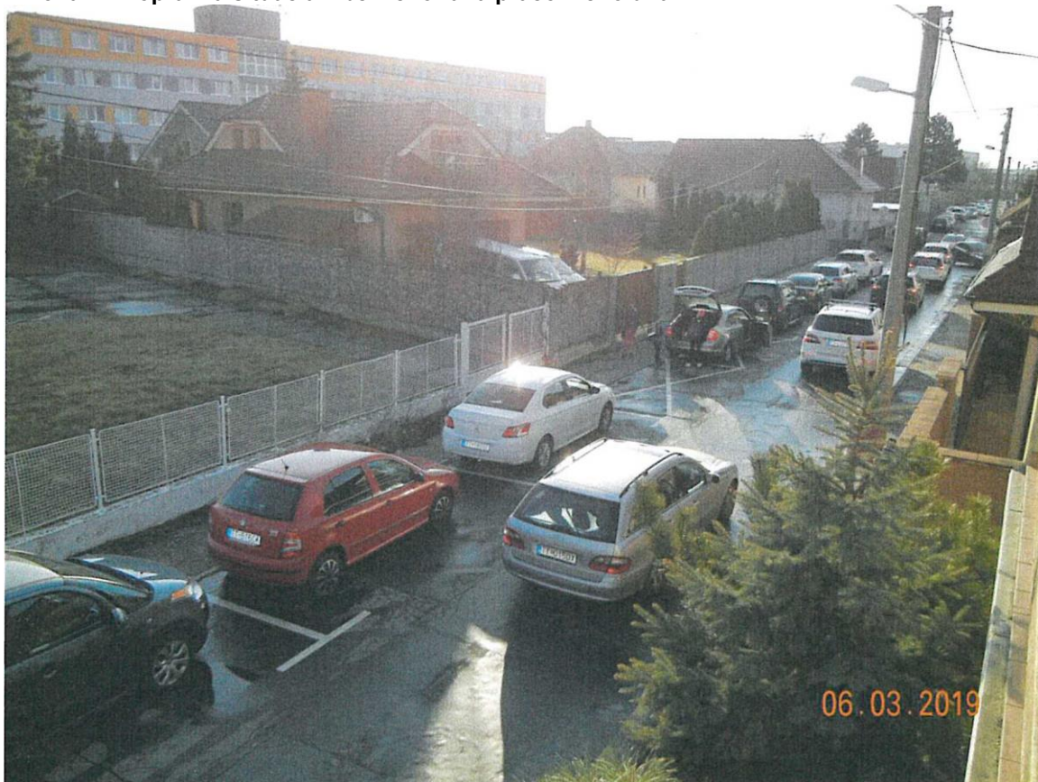
Príloha 1 - Dopravná situácia z bežného rána pracovného dňa