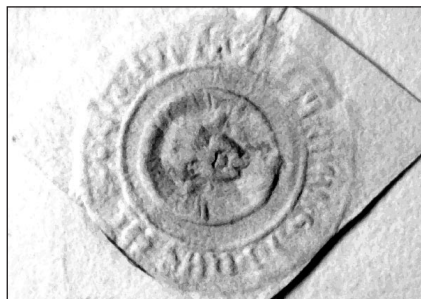
Pečať Trnavy na listine z roku 1418