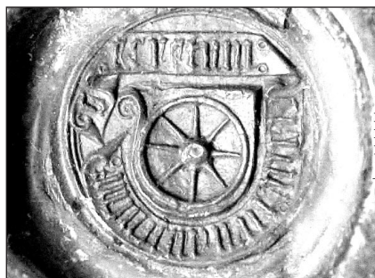
Pečať Trnavy na listine z roku 1493