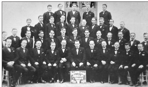
Bradlan v roku 1935

Pri príležitosti osláv 80. výročia založenia speváckeho zboru Bradlan pripravuje Západoslovenské múzeum v spolupráci so speváckym zborom výstavu venovanú histórii zboru. Jej otvorenie sa uskutoční v piatok 21. mája o 15. hodine. Oslavám bude venovaný aj spoločný koncert Bradlanu s nórsnym mužským spevokolom Vydre Mannskor z ostrova Gurskoy, ktorý sa začne v ten istý deň o 19. hodine v Divadle Jána Palárika.