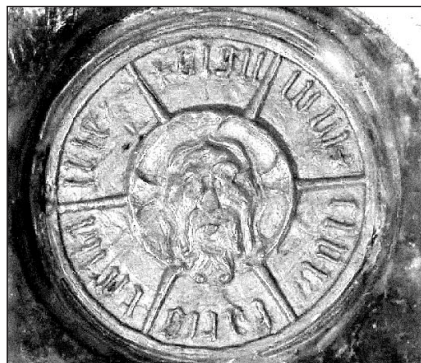
Pečať Trnavy na listine z roku 1472